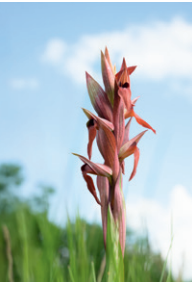
Dimitri Känel Orchidées sauvages de Suisse

Erfahren Sie, wie Bäume zu regelrechten Lebensräumen werden! Die Kinder entführen Sie mit ihren kreativen und originellen Werken in die faszinierende Welt der baumbewohnenden Insekten, Vögel und Kleinsäuger. Eine spielerische Kunstaussstellung, um mit der ganzen Familie über das vielfältige Leben zu staunen, das sich im Geäst, unter der Rinde oder in den Blättern versteckt.