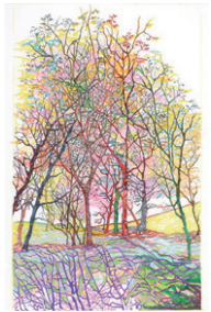
Véronique Walter Délicatesses forestières

28. März bis 17. Mai, Vernissage: 27. März, 17 Uhr Der Freiburger Fotograf Dimitri Känel ist durch die Schweiz gereist, um die rund 70 Orchideenarten zu dokumentieren, die bei uns heimisch sind. Sie wachsen in ganz unterschiedlichen Lebensräumen und faszinieren uns mit ihren attraktiven Blüten und trickreichen Bestäubungsstrategien. In der Ausstellung fügen sich die Fotografien zu einem wunderbaren Gesamtbild, das uns daran erinnert, wie wichtig der Schutz dieser gefährdeten Pflanzen ist.